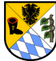
Ried i. I., OÖ

Besuch durch eine Schülerdelegation der BAKIP Ried in Polen.